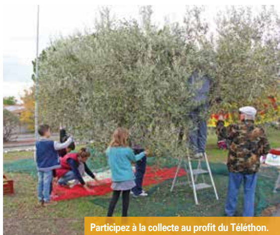
Participez à la collecte au profit du Téléthon.

Renseignements auprès de Rosy Guillaumin au 04 42 87 97 99 ou 06 67 68 11 90.