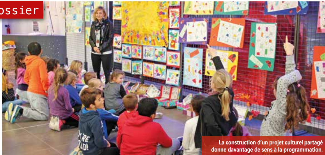
La construction d'un projet culturel partagé donne davantage de sens à la programmation.