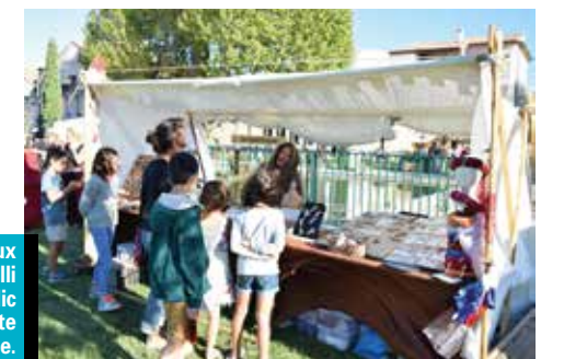
17 sept : Velaux 1514 a accueilli un large public pour sa fête Renaissance.