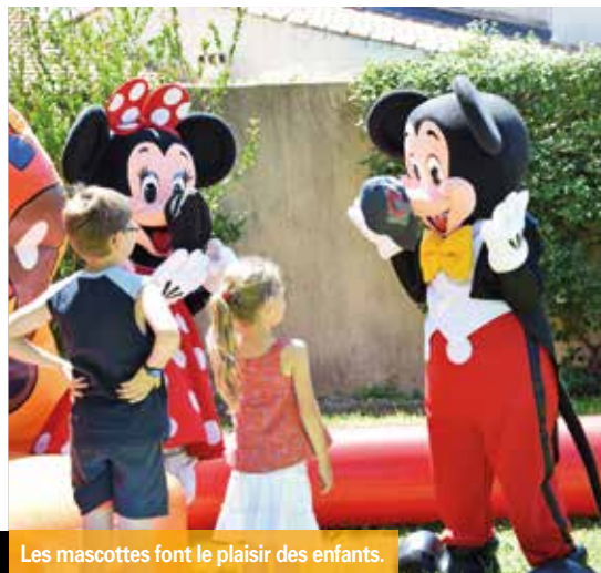
Les mascottes font le plaisir des enfants.