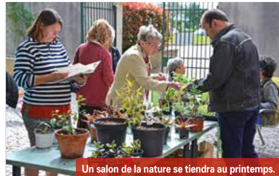
Un salon de la nature se tiendra au printemps.