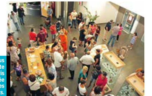
3 sept : plus de quarante personnes ont pris part à la matinée d'accueil des nouveaux arrivants.