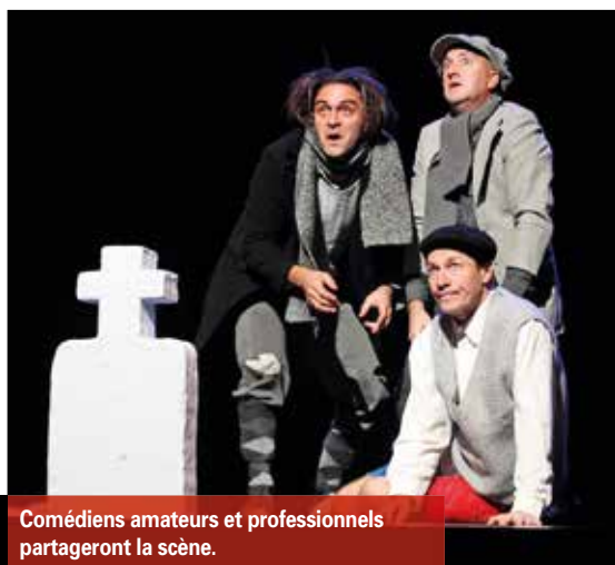
Comédiens amateurs et professionnels partageront la scène.

* Inscriptions avant le 14 octobre en envoyant nom, prénom, sexe et âge à sce.culture@mairie-de-velaux.fr . Réunion d'information obligatoire, en présence d'un parent, le vendredi 14 octobre à 18h30 et journée de sélection des candidats vendredi 21 octobre de 9h30 à 16h30, à l'Espace NoVa Velaux. Plus de renseignements en page 4 de l'Agenda.