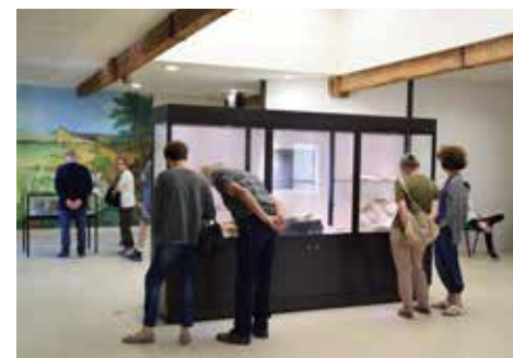
17 sept : les musées ont ouvert leurs portes aux visiteurs pour les Journées du patrimoine.