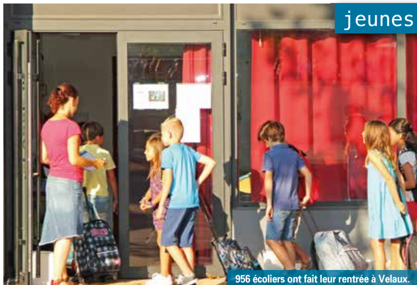
956 écoliers ont fait leur rentrée à Velaux.