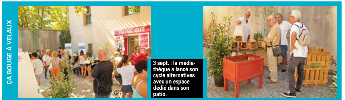
ÇA BOUGE À VELAUX