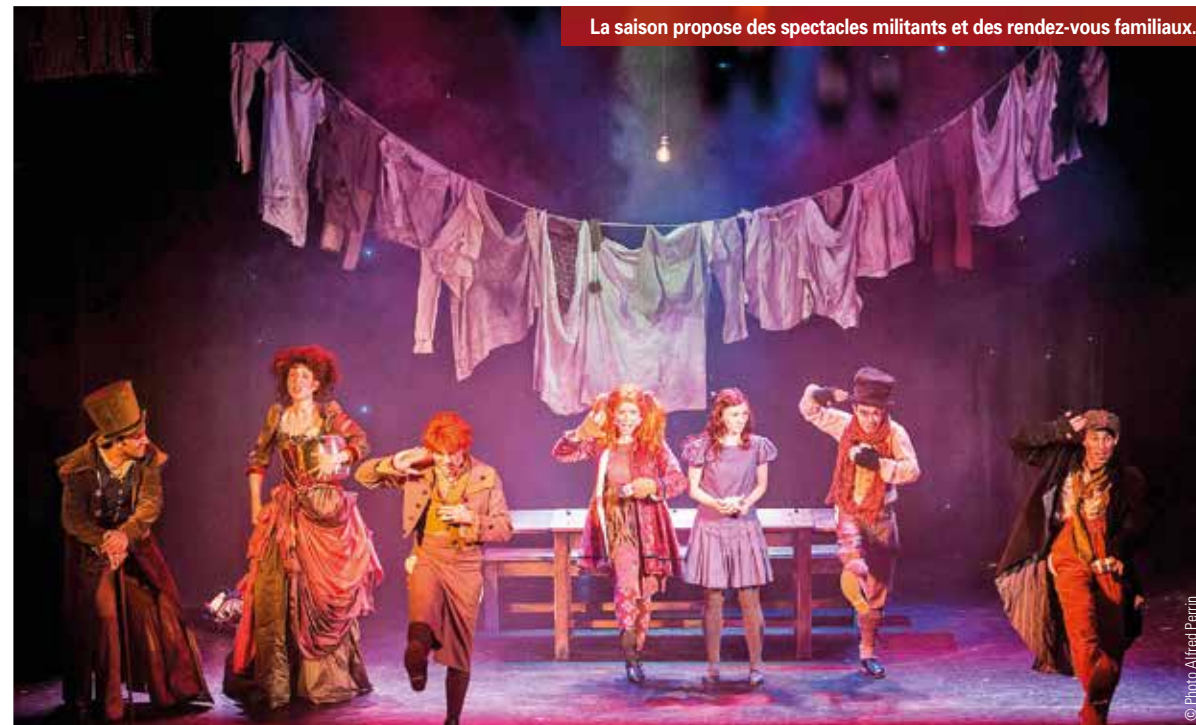
La saison propose des spectacles militants et des rendez-vous familiaux.