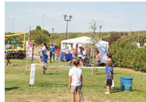
3 sept : le Forum des associations fut l'occasion de s'initier à différents sports.